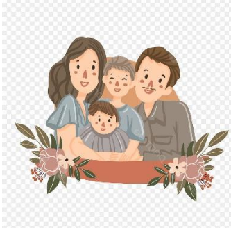
Foto Keluarga Bahagia

Keluarga Arman yang terdiri dari Pak Arman, Bu Arman, dan ke-5 anaknya ingin mengikuti lomba foto keluarga bahagia. Mereka pun melakukan pengambilan foto pada sebuah studio foto. Demi mendapatkan hasil terbaik, mereka mencoba berfoto dengan posisi berdiri dalam suatu baris atau duduk secara melingkar.